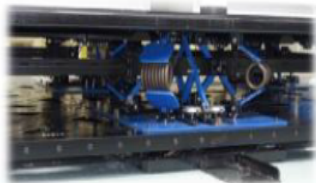
上下方向免震装置